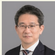
か も と も き 加茂具樹 総合政策学部長

1960年生まれ。1983年学習院大学経済学部卒業、1994年慶應義塾大学大学院経営管理研究科後期博士課程単位取得退学。公務員・企業経験を経て1995年武蔵大学着任、2005年慶應義塾大学商学部教授。塾内ではITC本部副所長、三田ITC所長、ハラスメント防止委員会委員長などを歴任し、2021年10月より現職。専門はマネジメント・コントロール、管理会計および組織行動。博士(経営学)。1999年度日本原価計算研究学会賞。